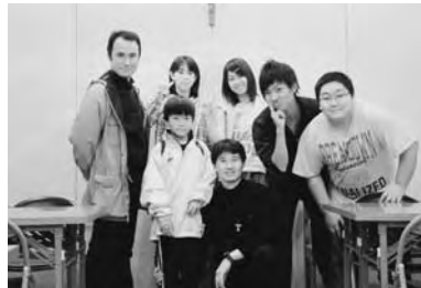
＝参加者の記念撮影＝

今回は、「勉強の秋」と言われている季節だけあって、「遊びをしながら勉強」という感じで、中高生たちと一緒に勉強しました。実際には勉強というほど