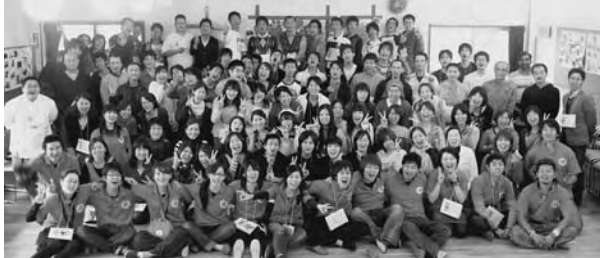
＝全国からの参加者で記念撮影＝

大会テーマである「タア タアンワ(ここにいる)」を、どう伝えていくか。それと同時に、参加者の皆さんに有意義な時間を過ごして楽しんでもらうために何をするか。試行錯誤の連続でした。大会が終わって