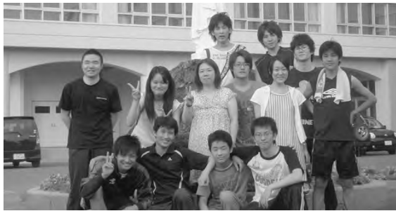
きたいと強く思いました。

生たちには「とっても楽しかった。またやりたい。」と言ってもらえたし、みんな楽しく遊べていたと思います。企画した僕自身も、翌日筋肉痛になるぐらい動き回りました。楽しく運動している時には疲れて気づかないものなんですね・・・。 今後中高生たちにとって、魅力的な企画をしてい