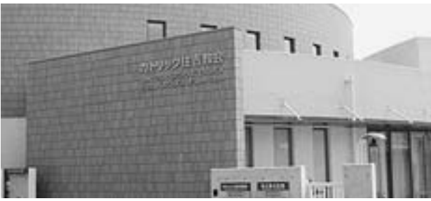
一新くなったカトリック住吉教会—

て、神戸地区三教会の新築を始めました。教会の再建は地域の復興がなされた後にしようと言ってきましたので、震災から12年半が経過してしまいました。思い起こせば、司教様をはじめ貴教区の方々に大変お世話になりました。私どもの感謝の意を、ご心配くださった全ての方々にお伝えしたいと思えます。再建に使われた教区新生資金の収支をご報告し、ここに改めて深くお礼申し上げます。感謝の言葉を述べられた。